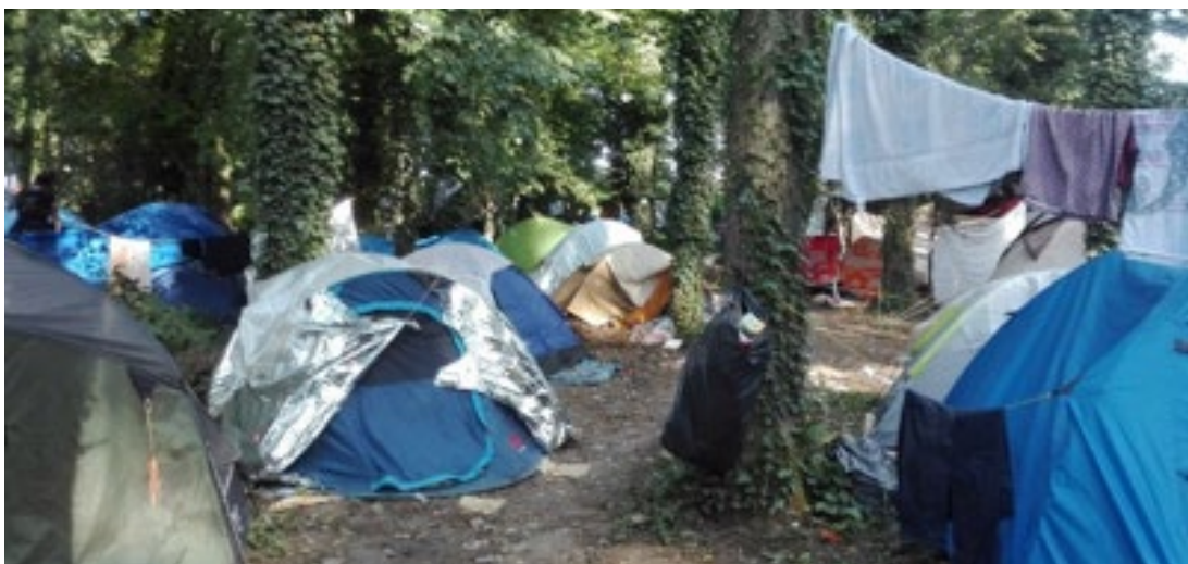
Camp à Grande-Synthe, août 2018

Les autorités ont mis en place un service régulier de maraudes pour permettre aux étrangers d'accéder à des centres d'accueil et d'examen des situations (CAES) ou des centres d'accueil et d'orientation (CAO), où ils peuvent également obtenir des informations sur la procédure d'asile. Les autorités françaises affirment que grâce à ces maraudes, tous les migrants et réfugiés à la rue peuvent être mis à l'abri et que personne n'est contraint de dormir dehors 19 .